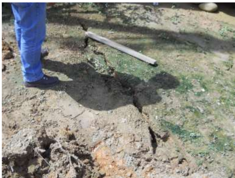
Foto 2. Agrietamientos de suelo limoarenoso

Durante los trabajos de evaluación de daños, se han observado grietas con longitudes decimétricas a centimétricas, con aperturas de hasta 50 cm y profundidades de hasta 1m. El suelo donde se presenta mayormente este fenómeno es limoso y arcilloso y su orientación es principalmente paralela a la playa de la Laguna Azul.