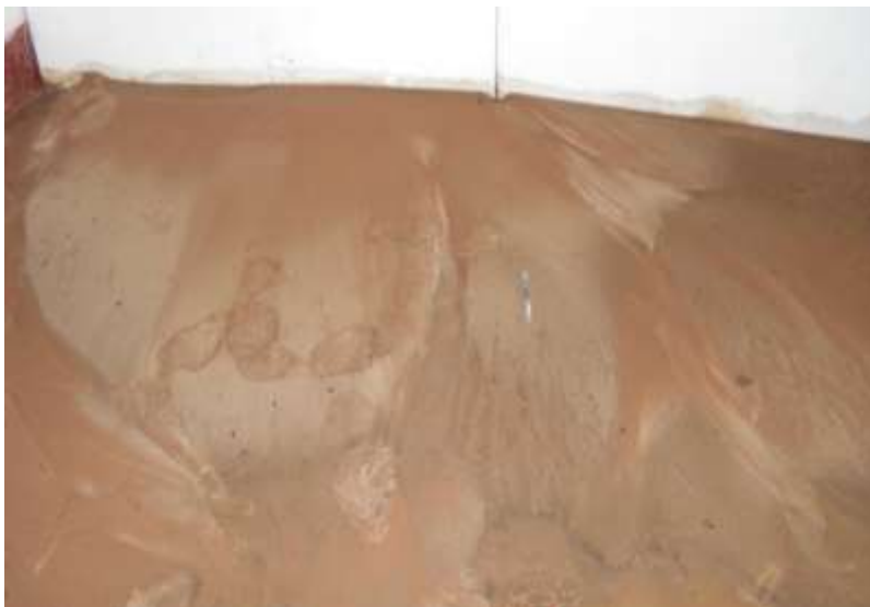
Foto 1. Volcán de arena de hasta 1m de radio dentro de una vivienda en el sector 2 de Mayo.