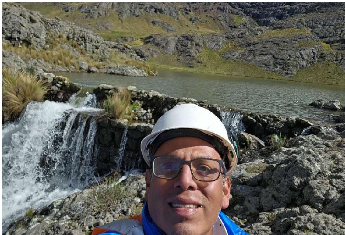
Figura N° 11: Vaso de la presa Urcuncocha.