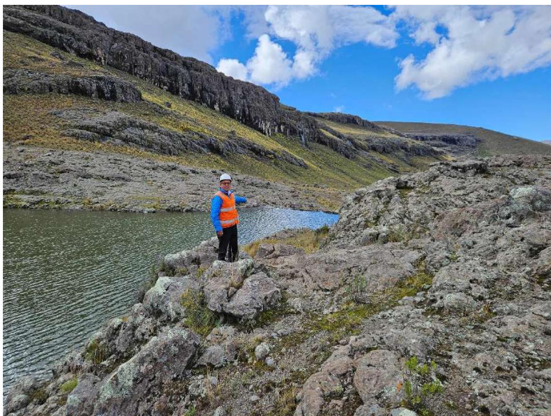
Figura N° 13: Sobrevertimiento y filtraciones de la presa Urcuncocha.