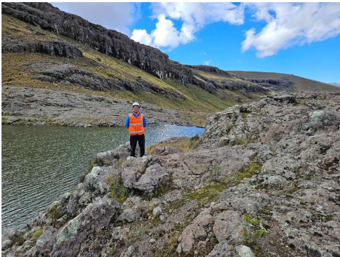
Figura N° 9: Vista general de la corona y paramento aguas abajo de la presa Urcuncocha.