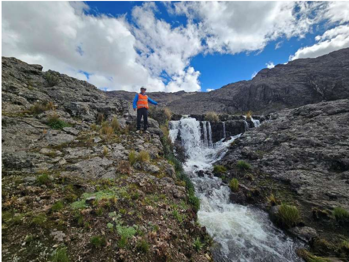
Figura N° 15: Vaso de la presa Urcuncocha.