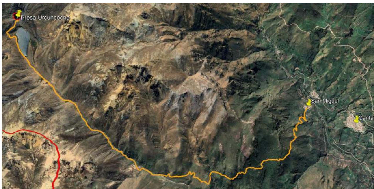
Figura N° 2: Vista general del vaso de la presa Urcuncocha.