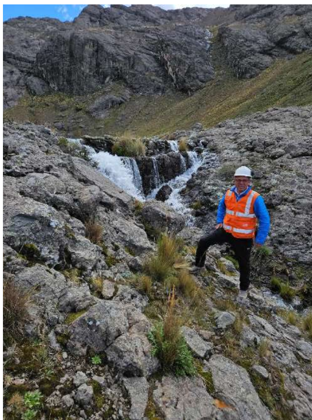
Figura N° 17: paramento aguas arriba de la presa Urcuncocha.