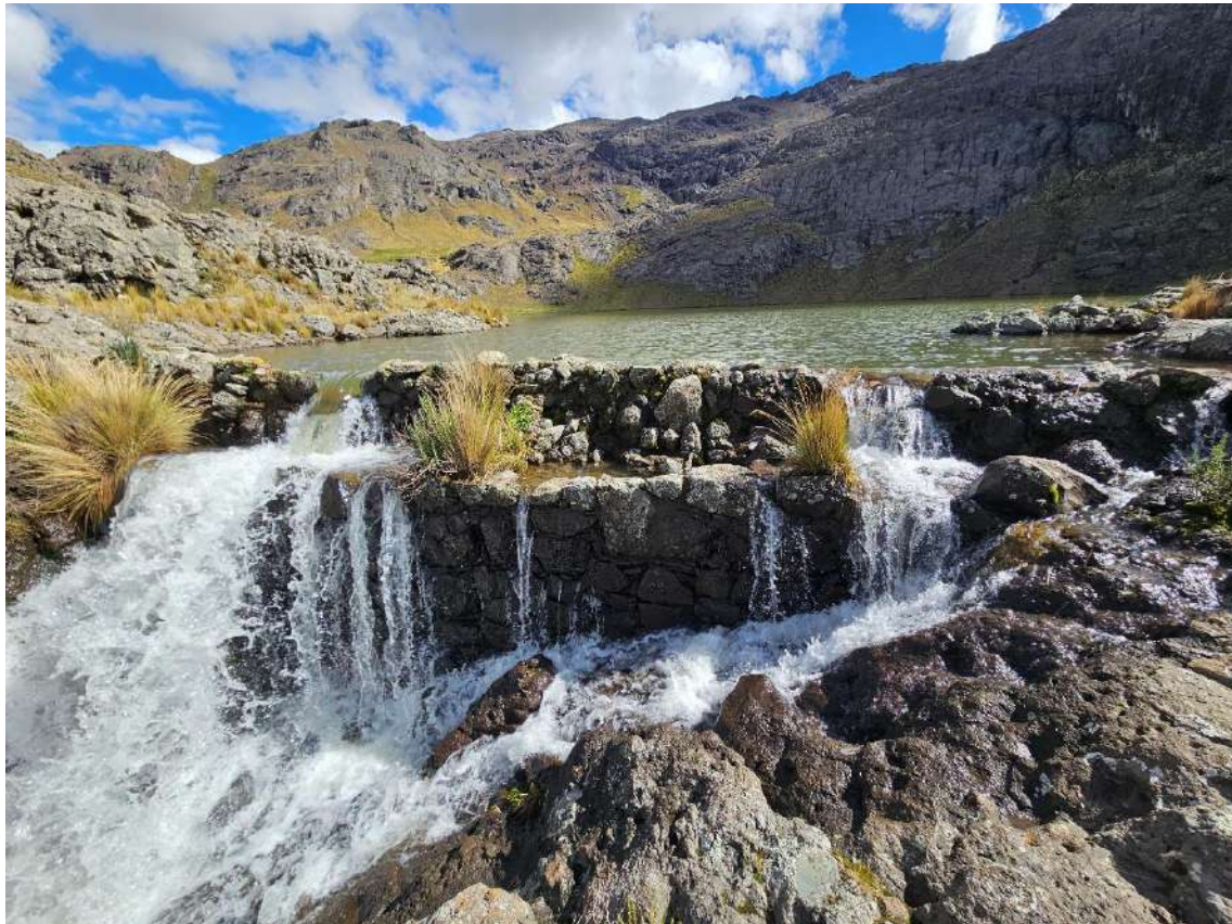
Figura N° 4: Corona de la presa Urcuncocha.