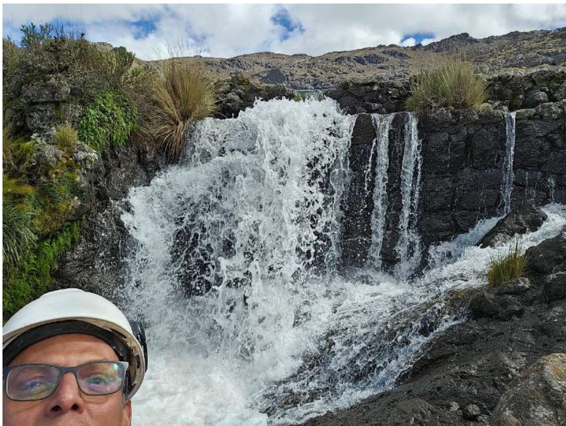
Figura N° 6: Paramento aguas abajo y salida de la tubería de descarga de la presa Urcuncocha.