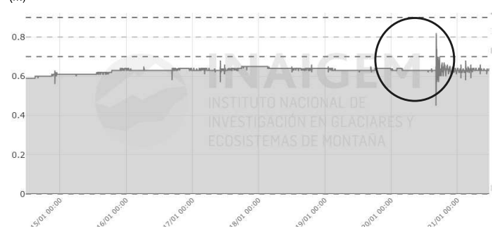
Figura 2. Registro del nivel del espejo de agua de los últimos 7 días

En la figura 2 se muestra el registro de los últimos 7 días del nivel del espejo de agua, donde se resalta el incremento en el día 20 de enero del 2026 (círculo de color azul). Este pico coincide con el evento de oleaje registrado.