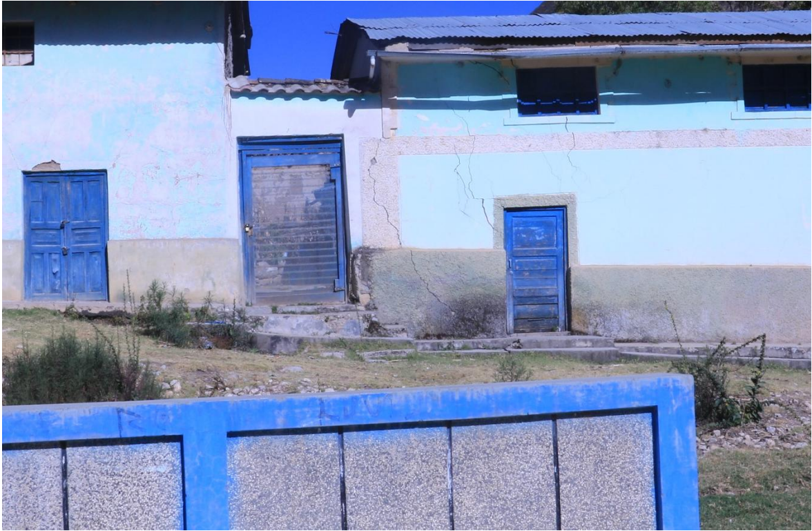
Foto 03. Vivienda ubicada a 35 m de la corona del deslizamiento (deslizamiento ubicado a la izquierda de la foto), presentando grietas paralelas al plano del deslizamiento y con buzamiento en contra de la pendiente, lo cual nos indica el asentamiento de la vivienda.