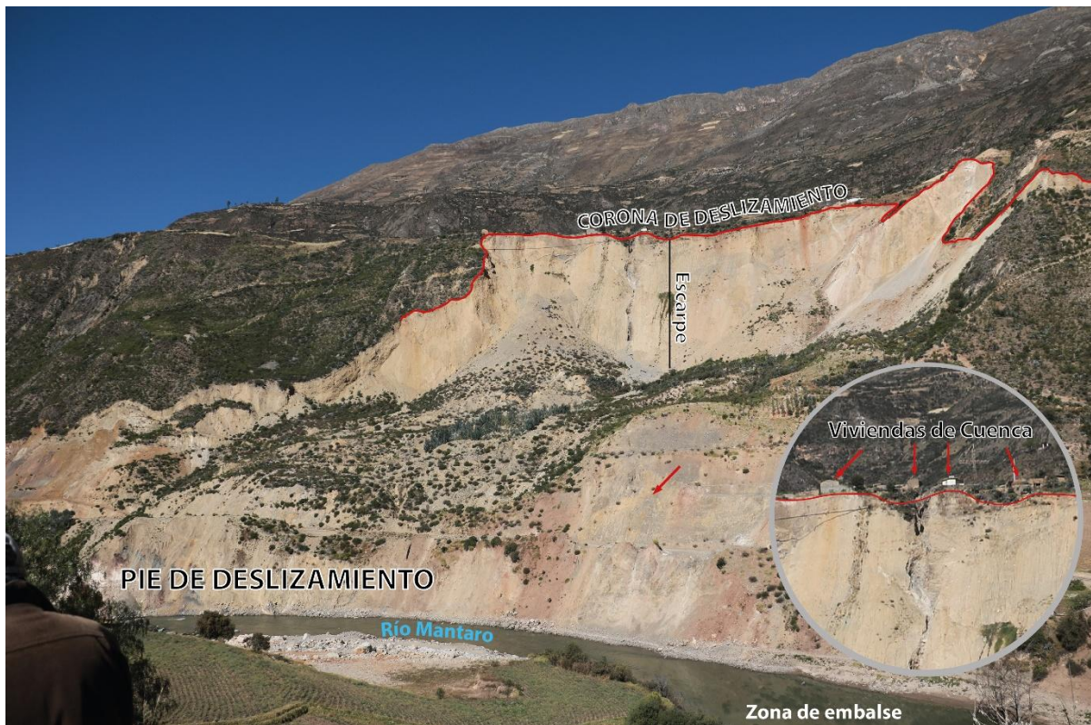
Figura 02. Partes del deslizamiento de Cuenca, véase en el zoom de la derecha la ubicación de las viviendas de Cuenca al borde de la corona del deslizamiento.

La población de Cuenca, ubicado en la parte superior del deslizamiento, presenta un sistema de drenaje precario, considerando que su sistema de desagüe y alcantarillado se encuentran erosionando constantemente la corona del deslizamiento.