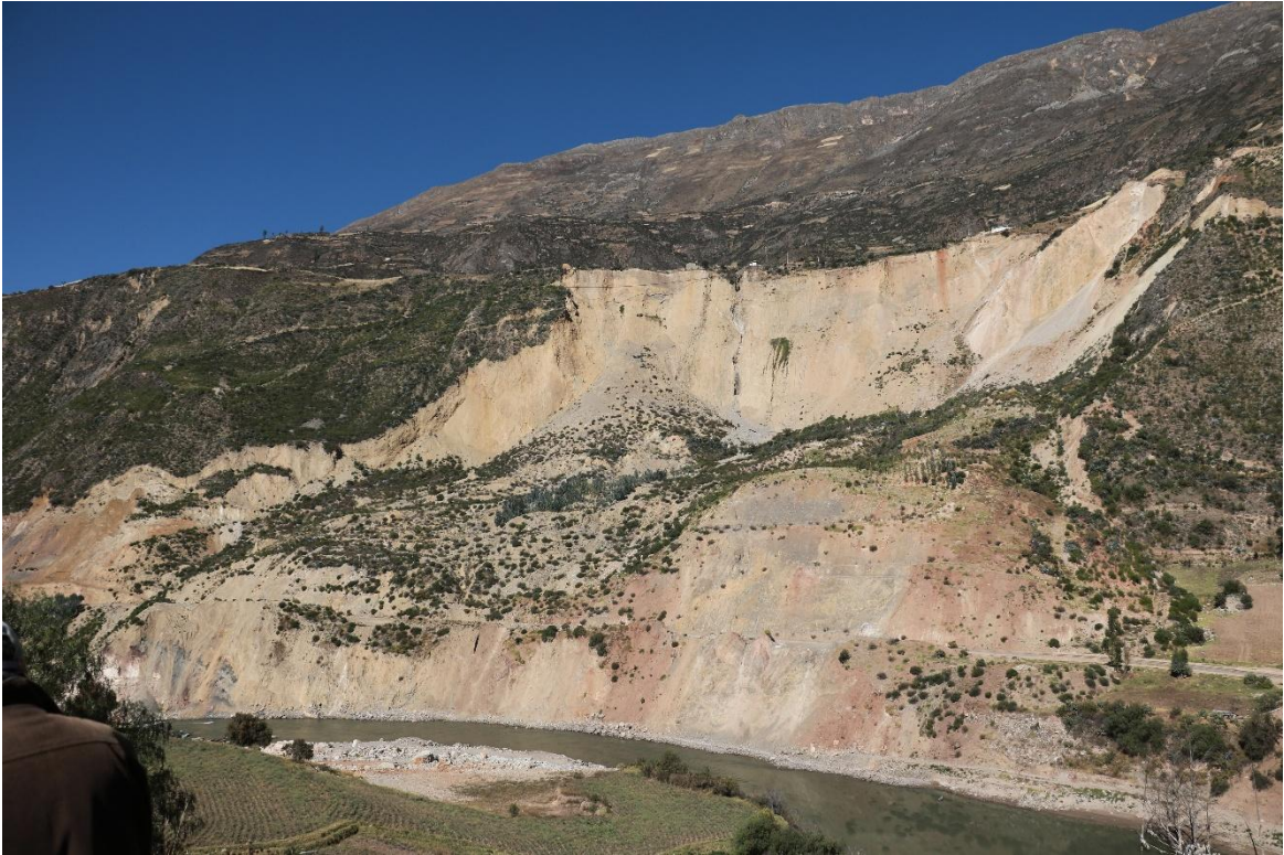
Foto 01. Fotografía del actual estado del deslizamiento de Cuenca, aún en estado de actividad en sus zonas de mayor pendiente, evidenciado por la falta de vegetación.