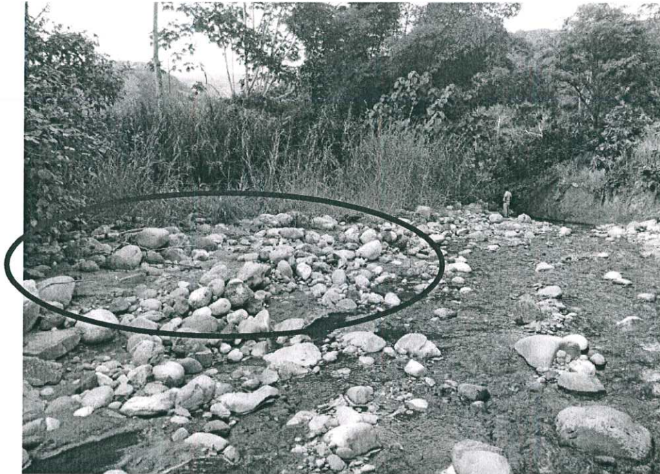
Foto N° 11. Se observa el punto final del recorrido, cauce descolmatado.