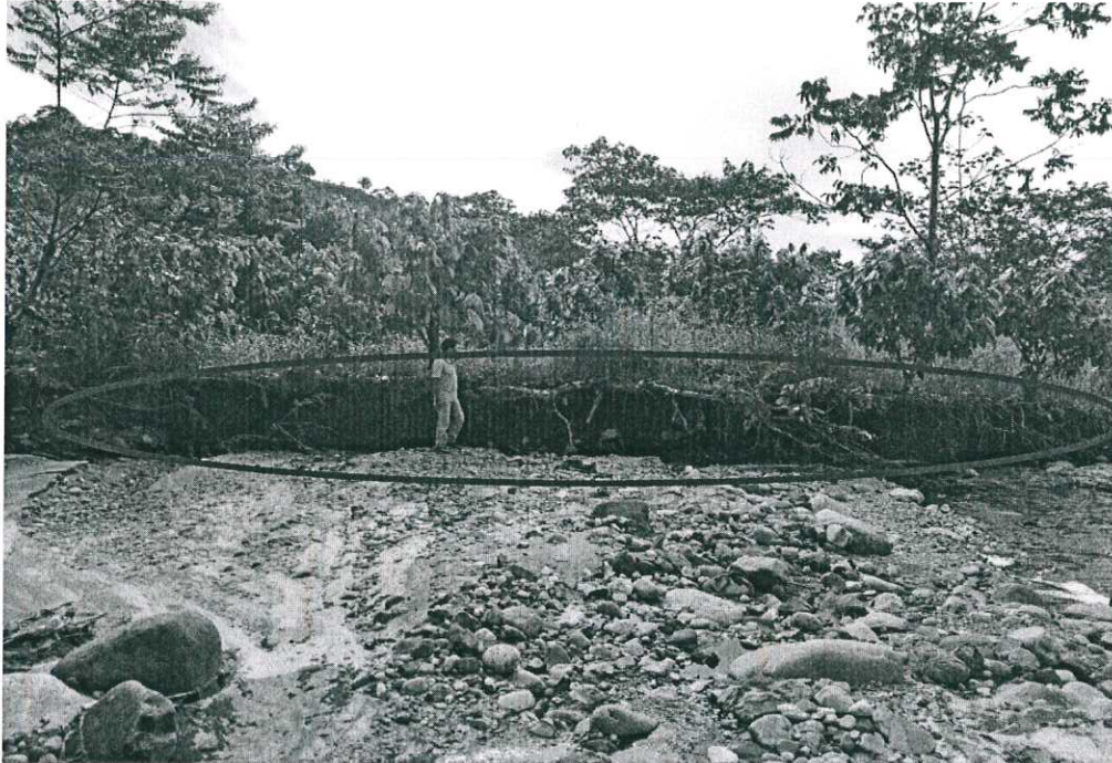
Foto N° 05. Se Oberva cultivos de caco, plátano, especies forestales afectados.