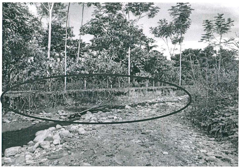
Foto N° 08 y 09. Se observa cultivos de cacao afectados por la erosión del río.

"Año del Dialogo y la Reconciliación Nacional"