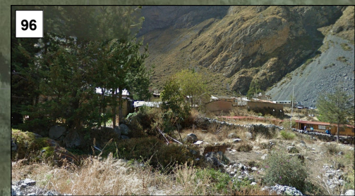
Centros Poblados Vulnerables en el Departamento Lima