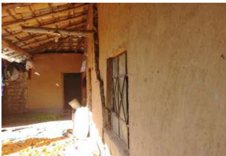
Foto N° 03: Movimiento lateral de las paredes debido al agrietamiento del terreno.