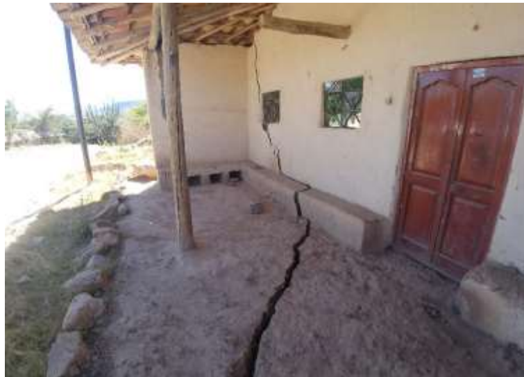
Foto N° 05: Vivienda inhabitable con agrietamientos en las paredes y pisos