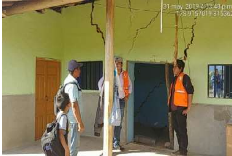
Foto N° 04: Vivienda inhabitable con agrietamientos en las paredes y pisos