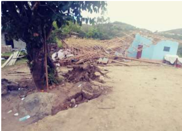
Foto N° 02: Vivienda colapsada debido al agrietamiento del terreno.