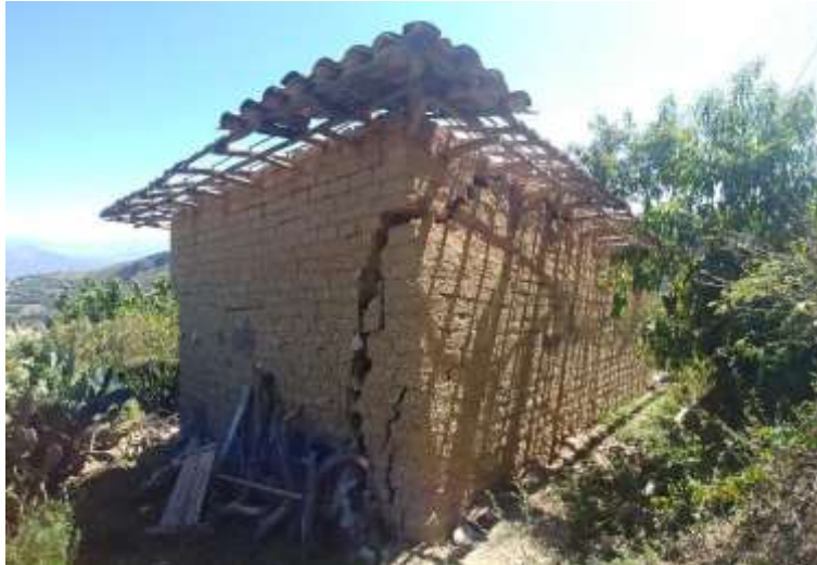
Foto N° 01: Vivienda inhabitable con agrietamientos en las paredes.