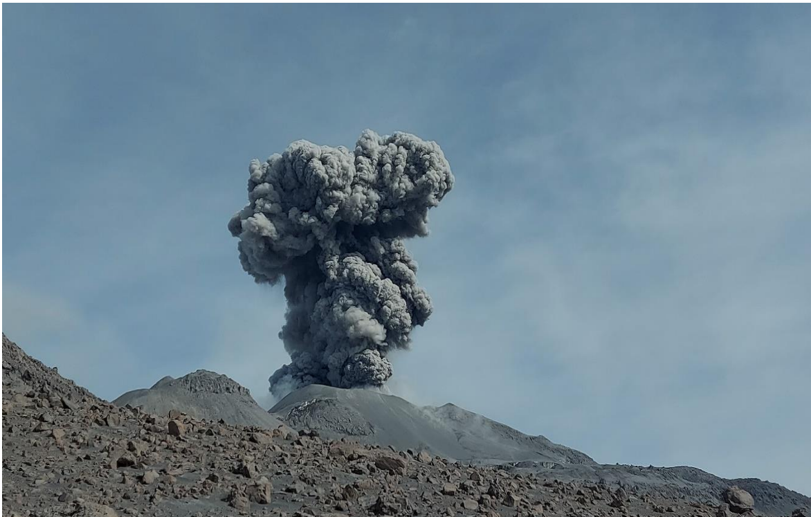
Figura 1: Volcán Sabancaya en la región Arequipa.

En el volcán Sabancaya (Figura 1), desde abril del presente año, la red de monitoreo geofísico implementada por el Instituto Geofísico del Perú (IGP) ha venido registrando la ocurrencia promedio de 42 explosiones diarias, con un máximo de 85 eventos observados el 10 de mayo, así como, el registro ininterrumpido de hasta 7 horas de tremores volcánicos. Además, entre los días 20 de abril y 14 de mayo del presente año, la energía sísmica generada por la actividad volcánica, ha mostrado un incremento acelerado, al pasar de 50 MegaJoules (MJ) a 225 MJ. Actualmente, la actividad sísmica asociada a la ocurrencia de explosiones ha disminuido y se mantiene por debajo de 20 eventos por día, similar comportamiento presenta el resto de información asociadas a la dinámica y circulación de fluidos volcánicos (eventos Largo Periodo y Tremores).