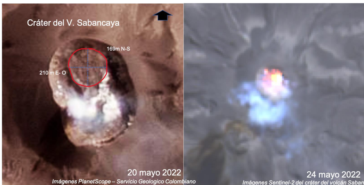
Figura 4.- Imágenes PlanetScope y Sentinel del cráter del volcán Sabancaya en la cual se distingue el domo de lava y la anomalías térmicas que este genera.

Del mismo modo, las mediciones de gases emitidos por el volcán Sabancaya muestran el incremento de la tasa de emisión de \text{SO}_2 desde el 18 de marzo hasta el 1 de abril, con un máximo de 7898 Toneladas/día. Actualmente, se observa una tendencia a la baja de dichas emisiones de gases con valores promedio de 891 Toneladas/día.