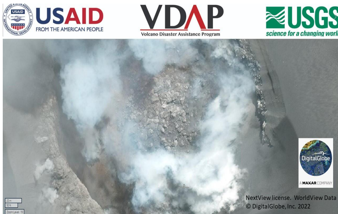
Figura 3.- Imagen satelital Digital Globe obtenida el 12 de mayo del cráter del volcán Sabancaya donde se aprecia el domo de lava (cortesía de USAID-VDAP-USGS).

Por otro lado, en la imagen satelital de Digital Globe obtenida para el 12 de mayo (Figura 3) se observa el domo de lava en crecimiento y que en la actualidad, sus dimensiones obtenidas a partir de una imagen PlanetScope del 20 de mayo, es de 210 m de diámetro en dirección Este-Oeste y 169 m de diámetro en dirección Norte-Sur (Figura 4).