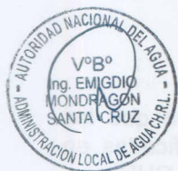
CUADRO N° 1

ARTÍCULO PRIMERO: MODIFICAR la Resolución Administrativa N° 263-2001-AG-DRA/ATDR.CHRL, en el extremo que establece las coordenadas de los hitos de la faja marginal del Río Chillón, estableciéndose el cuadro N°01 para la margen derecha y el cuadro N° 02 para la margen izquierda, conforme a los cuadros siguientes: