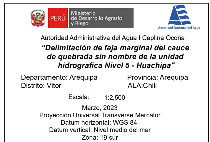
Base gráfica de la AAA Caplina Ocoña - Area Técnica