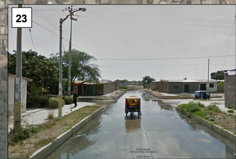
La Cola Del Alacran