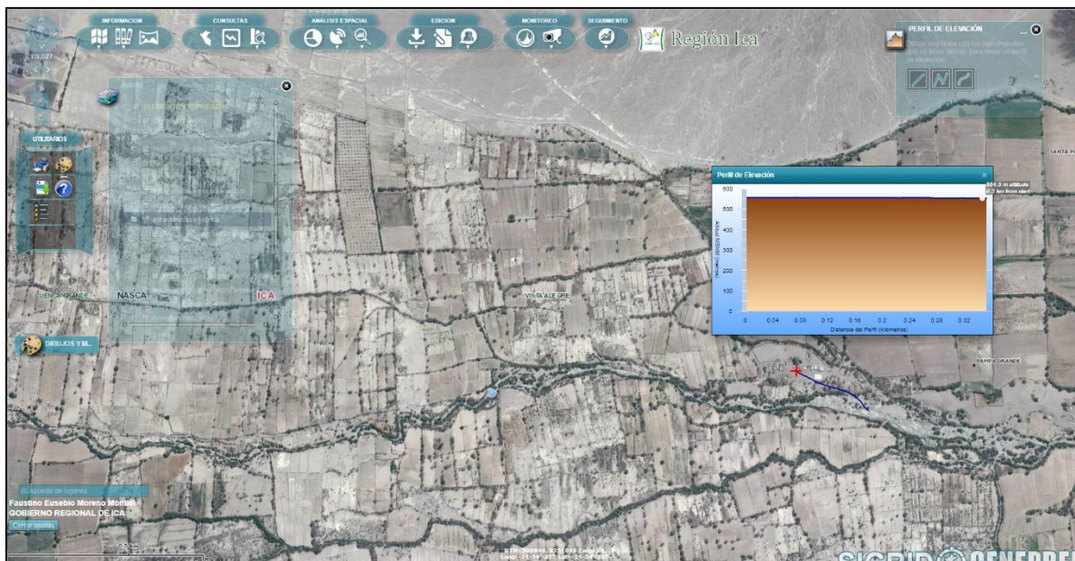
Diferencias de cota de nivel del río Taruga con los centros poblados aledaños

En el área inundable existen 50 viviendas de material de adobe, 15 viviendas de material noble, 1 centro de salud, red de agua con puntos de pileta y utilización de desagüe con pozo sépticos, colegio de educación inicial, infraestructura eléctrica de media y baja tensión.