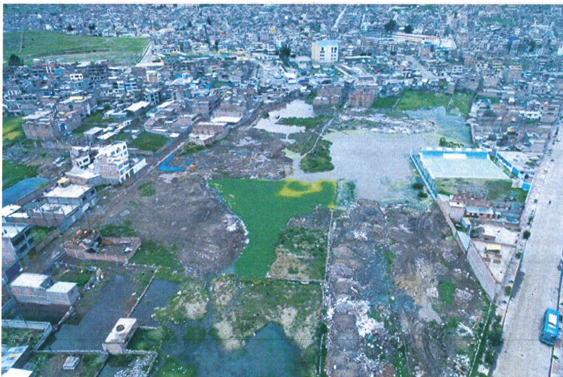
Imagen 06 – Inundación del Rio Torococha – centro urbano de la ciudad de Juliaca