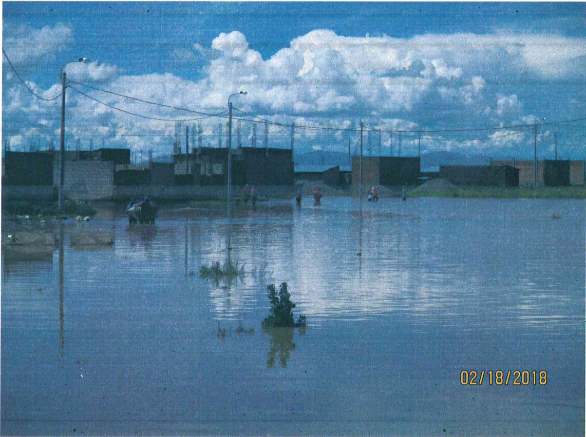
Imagen 04 – Inundación del Rio Coata – Urb. San Carlos de la Ciudad de Juliaca