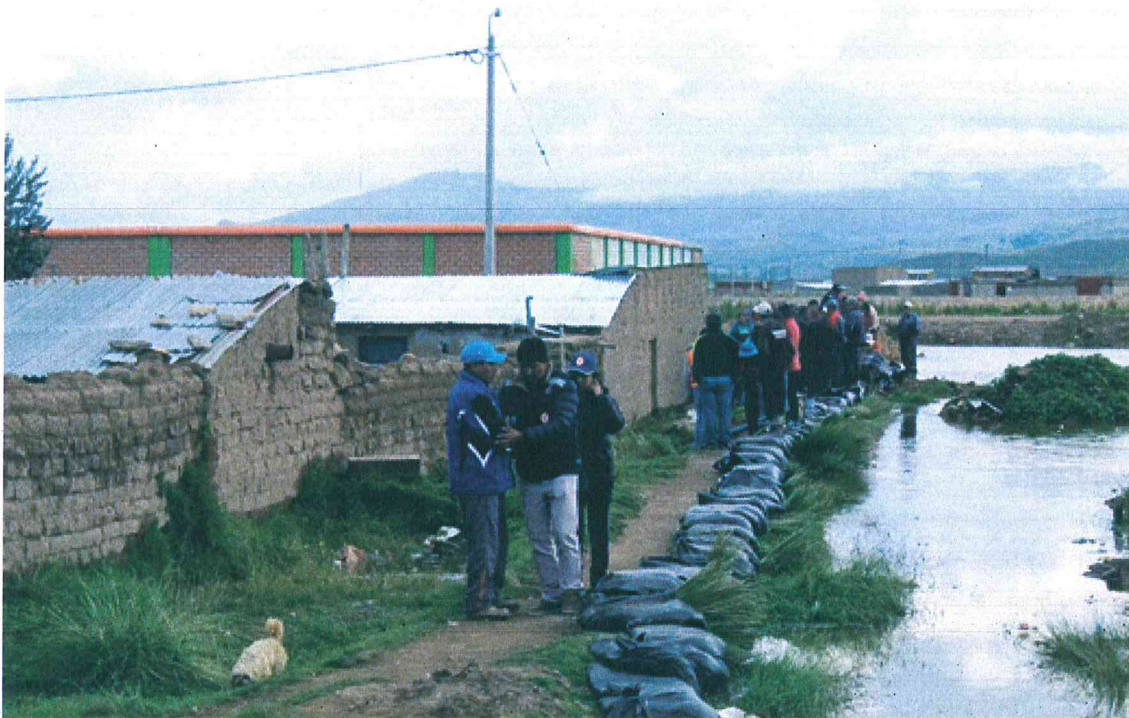
Imagen 02 – Inundación del Rio Cabanillas – Defensa con sacos terreros - Provincia de Lampa.