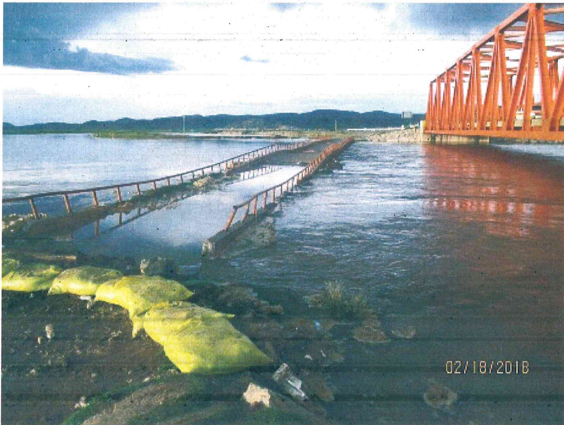
Imagen 05 – Inundación del Rio Coata – Puente en Peligro - Distrito de Caracoto