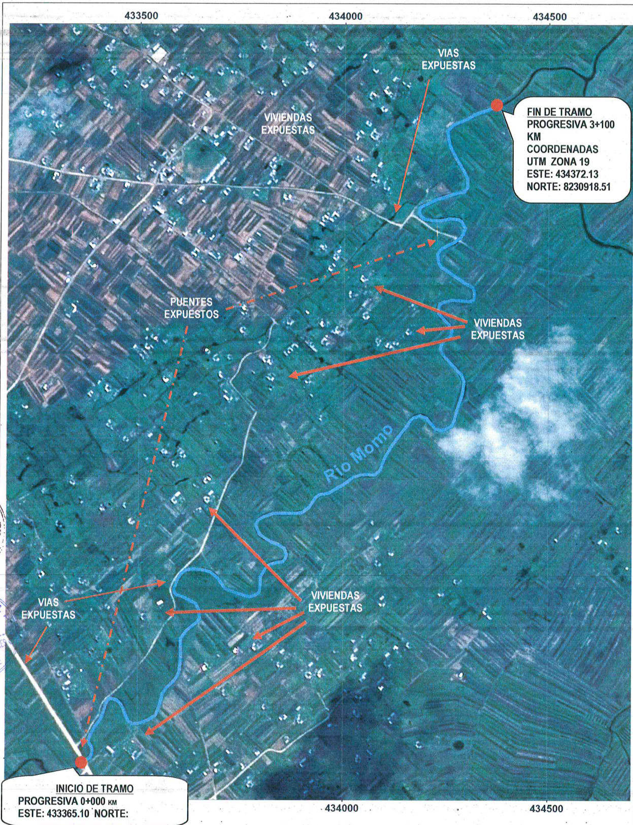
CROQUIS IMAGEN SATELITAL SE APRECIA LA ZONA A INTERVENIR INICIO Y FINAL DEL TRAMO.PARA LA DESCOLMATACION Y CONFORMACION DE DIQUE DEL CAUCE DEL RIO MOMO DE LA COMUNIDAD CAMPESINA PAMAYA JICHUYO.