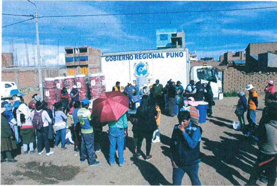
Imagen 07 – Inundación del Rio Coata – Ayuda Humanitaria - ciudad de Juliaca