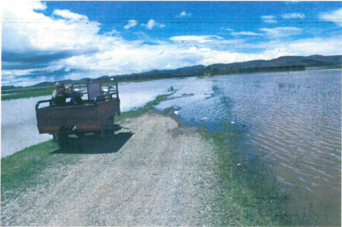
Imagen 03 – Inundación del Rio Coata – Accesos vial al Cementerio Inundado.