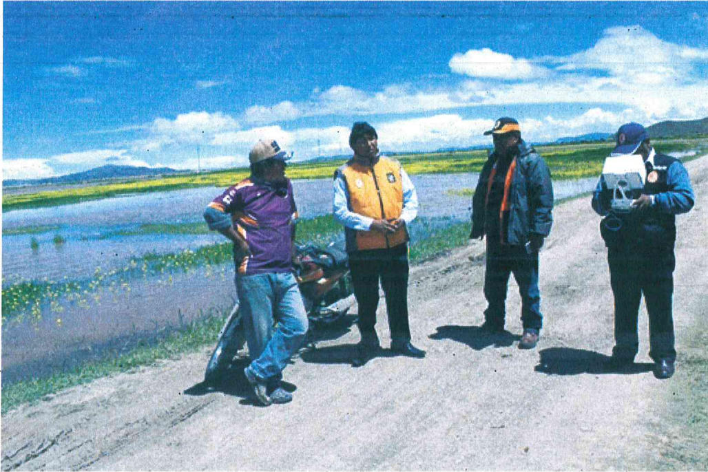
Imagen 01 – Inundación Rio Coata - Preparando para el monitoreo vuelo Drom