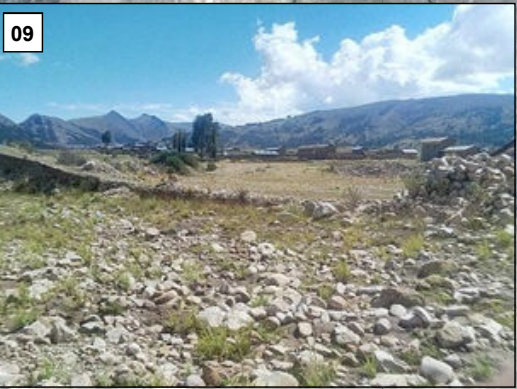
Centros Poblados Vulnerables en el Departamento Puno