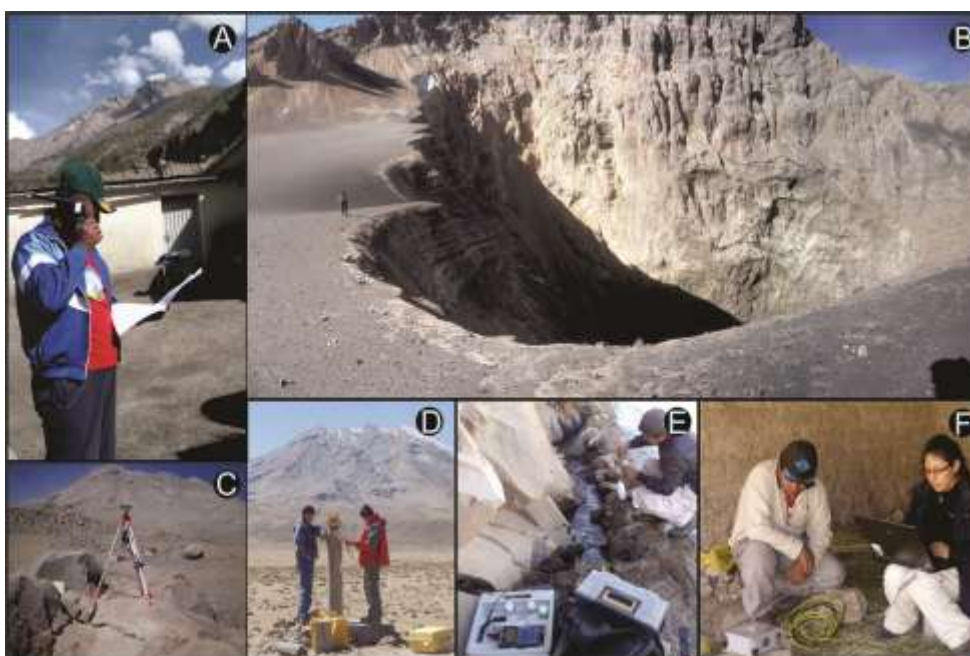
Figura 1. Monitoreo del volcán Ubinas con los métodos: visual de fumarólas desde el poblado de Ubinas (A) y del interior del cráter (B), geodésico utilizando GPS (C) y utilizando EDM (D), geoquímico en fuentes de agua (E), y sísmico (F).

Una de las funciones del INGEMMET es identificar, estudiar y monitorear los peligros asociados a la actividad volcánica, en ese sentido, el INGEMMET viene trabajando en el monitoreo volcánico multidisciplinario del volcán Ubinas desde septiembre del 2005 (Figura 1). Este monitoreo inicialmente se realizó con técnicas geoquímicas con la medición de parámetros físico-químicos de fuentes termales y visuales a partir de las características de las fumarólas (realizado con el apoyo de la Municipalidad Distrital de Ubinas). Por otro lado, se realizaron algunos estudios sismológicos temporales durante los años 2006, 2011 y 2012. Además, desde el 2008 se instaló una red de monitoreo geodésico para estudiar la deformación del edificio volcánico. Actualmente, el monitoreo volcánico se realiza con estos cuatro métodos.