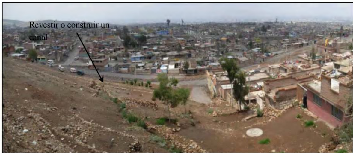
Foto N°25.- En este sector se debe construir un sistema de drenaje, revistiendo el canal existente o diseñando otro canal cerrado o tunel de agua.