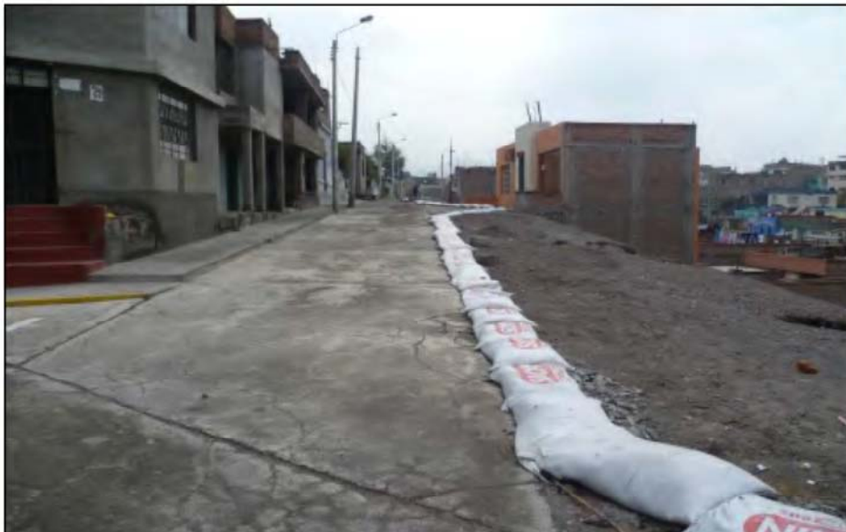
Foto N°11. Vista de la calle Mollendo (tramo 1), la cual en parte está cubierta con losas de cemento. El derrumbe se produce en el extremo derecho (zona descubierta).

Sobre la calle Mollendo existen 3 viviendas, en las que viven 3 familias (aproximadamente 13 personas). Mientras que al pie del talud o de la calle Mollendo, se identificaron 3 viviendas en las que viven 8 familias (aproximadamente 32 personas). Por lo tanto, en el tramo 1 se han identificado 8 viviendas en las cuales habitan cerca de 17 familias. Dichas viviendas tienen por lo menos 30 años de antigüedad, según versiones de sus habitantes. El material sobre el cual están asentadas dichas viviendas son secuencias de flujo pómez y ceniza, material poco cohesivo que está totalmente descubierto. La calle Mollendo está en parte recubierta con losas de cemento y en otras partes está totalmente descubierta (Foto N° 11).