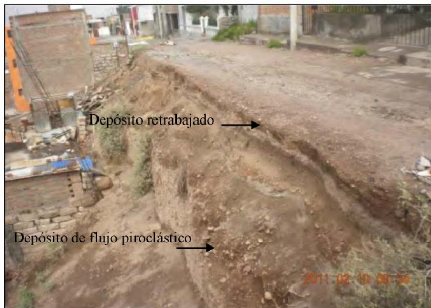
Foto N° 3. Vista de un depósito de flujo piroclástico en la calle Mollendo sobre el cual se han construido viviendas.