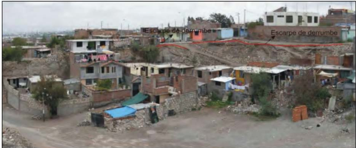
Foto N° 9. Vista de la escarpa de derrumbe en la calle Ricardo Palma (tramo 2), visto desde la Av. Independencia.