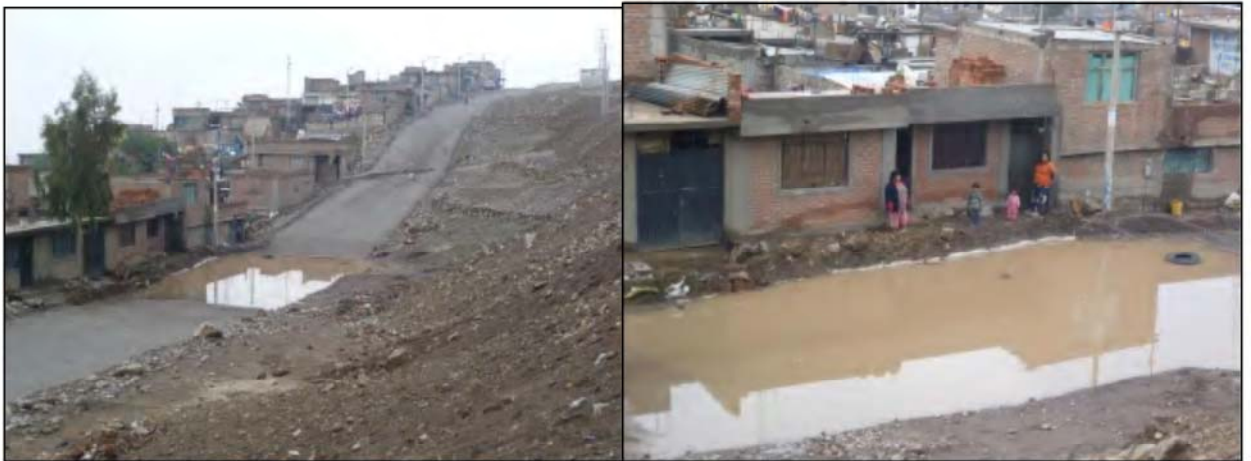
Foto N°21. Estado de casas ubicadas en la “Isla” (Villa Unión) inundadas con aguas de lluvias recientes.