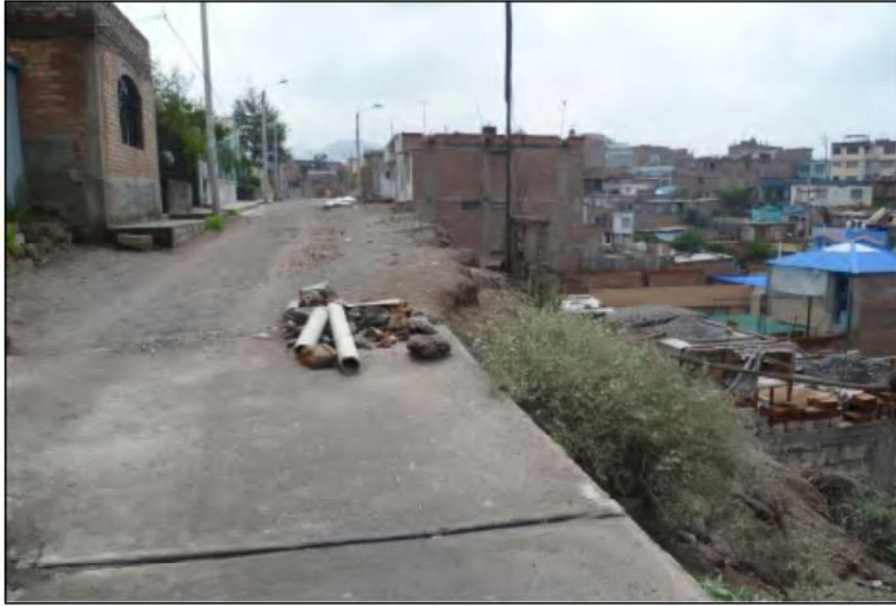
Foto N°13. Vista de la calle Mollendo (tramo 2), la cual en parte está cubierta con losas de cemento. El derrumbe se produce en la zona descubierta