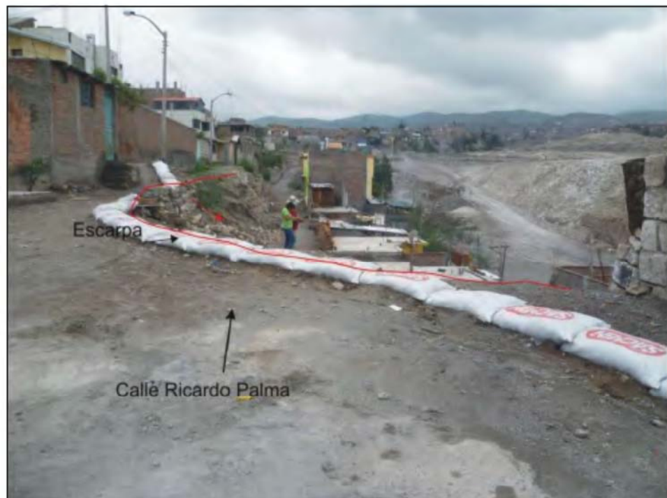
Foto N° 8. Vista de la calle Ricardo Palma (tramo 2) donde se aprecia que parte de dicha calle, postes de luz y tubos de agua y desagües vienen siendo afectados por problemas de erosión y derrumbes.