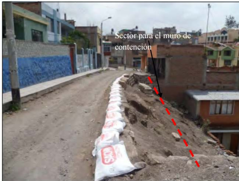
Foto N°24.- Al igual que en la calle Mollendo, en otros sectores donde se produce erosión de laderas y derrumbes se puede colocar muros de contención.