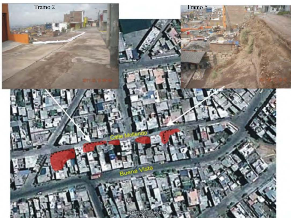
Foto N° 10. Imagen Google de la calle Mollendo, entre 2da y 3ra cuadra, donde los procesos de erosión y derrumbe vienen afectando dicha calle y viviendas. Además se presentan dos vistas de las áreas estudiadas.