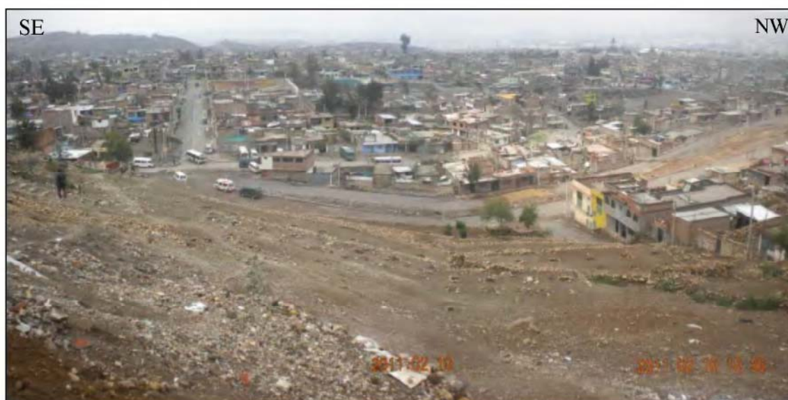
Foto N°19. Vista de la ladera hacia Villa Unión (zona alta de Javier Heraud).

Comprende una zona de ladera de 30° a 40° de inclinación. Esta ladera tiene aproximadamente 80 m de altura y está compuesto por material coluvial y por material de desmonte o inconsolidados, por tanto fácilmente deleznable (Foto N°19). Estos depósitos cubren flujos de lava andesíticos. En los extremos noroeste y sureste de esta ladera se han asentado viviendas, construidas con ladrillos y cemento (Foto N°19). En el extremo noroeste se identificaron 10 viviendas en general de 1 piso, como máximo 2 pisos, en las que viven aproximadamente 12 familias (cerca de 48 personas). Las casas que se encuentran al pie de la ladera están construidas de ladrillo y concreto.