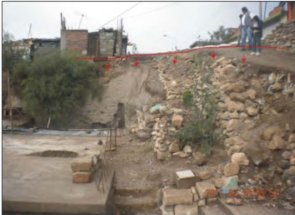
Foto N° 7. Vista de la Calle Ricardo Palma (tramo 2) que viene siendo afectado por problemas de erosión y derrumbes.