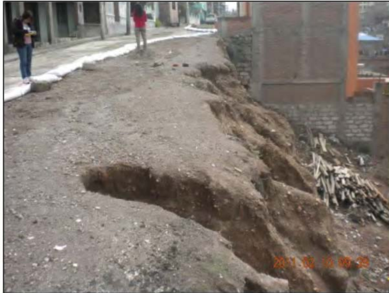
Foto N°1. Los suelos en el Distrito de Alto Selva Alegre son muy poco desarrollados. Aquí una vista de un depósito de flujo piroclástico en la calle Mollendo donde el suelo es casi inexistente.