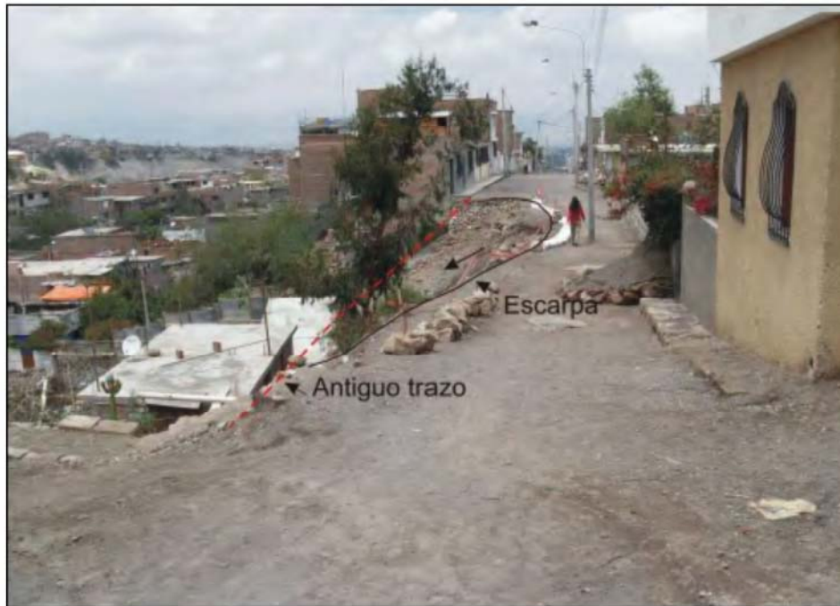
Foto N°4. 4ta cuadra de la calle Ricardo Palma, donde los procesos de erosión y derrumbe han afectado un tramo de 35 m de dicha calle.

En esta zona, las rocas del substrato corresponden a flujos piroclásticos de pómez y cenizas de 10 a 12 m de altura, de mala calidad, de resistencia blanda (5 - 25 Mpa), fácilmente deleznable, cubiertos por material de relleno de más de 4 m de espesor, siendo estos últimos, materiales de mala calidad geotécnica. Este depósito forma un talud de 60° a 80° de inclinación. Esta zona presenta problemas de erosión de ladera y derrumbes del talud afectando viviendas cercanas a esta (Foto N°4), los cuales están poniendo en descubierto las tuberías de desagüe, buzones o pozas de desagüe, y afectando las calles. Esta erosión se ha dado desde hace varios años atrás (según versiones de los pobladores) como producto principalmente de lluvias y de roturas de desagües (por el relleno mal compactado); ocasionando derrumbes de rocas y de material suelto, desde luego afectando 4 a 5 viviendas localizadas al pie del talud. Si el proceso se magnificara representaría un riesgo para las seis familias (en 6 viviendas) que viven al pie de la ladera.