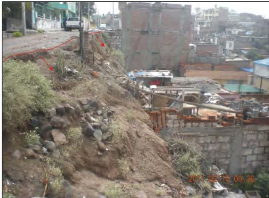
Foto N°14. Vista de la calle Mollendo (tramo 2) afectada por problemas de erosión de ladera y derrumbes

En este tramo se vienen produciendo procesos de erosión de laderas y derrumbes que afectan seriamente viviendas, tramo de la calle y tuberías de agua y desagüe, sobre todo en épocas de lluvia (Fotos N° 13 y 14).