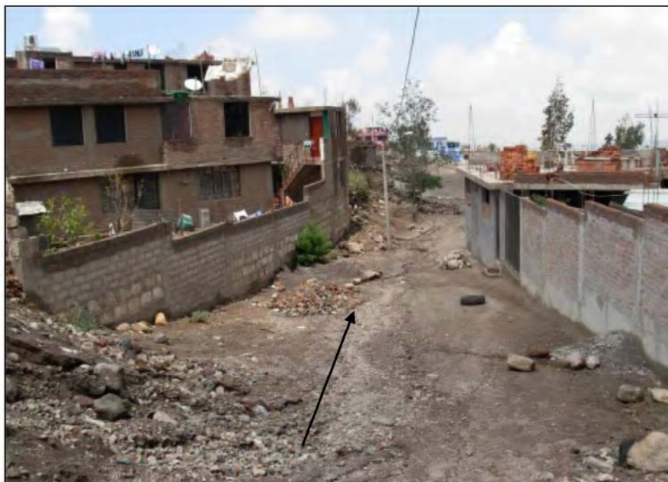
Foto N°22. Vista del sector tripartito (sector 3). La flecha señala la dirección de flujos de barro que bajan en época de lluvia