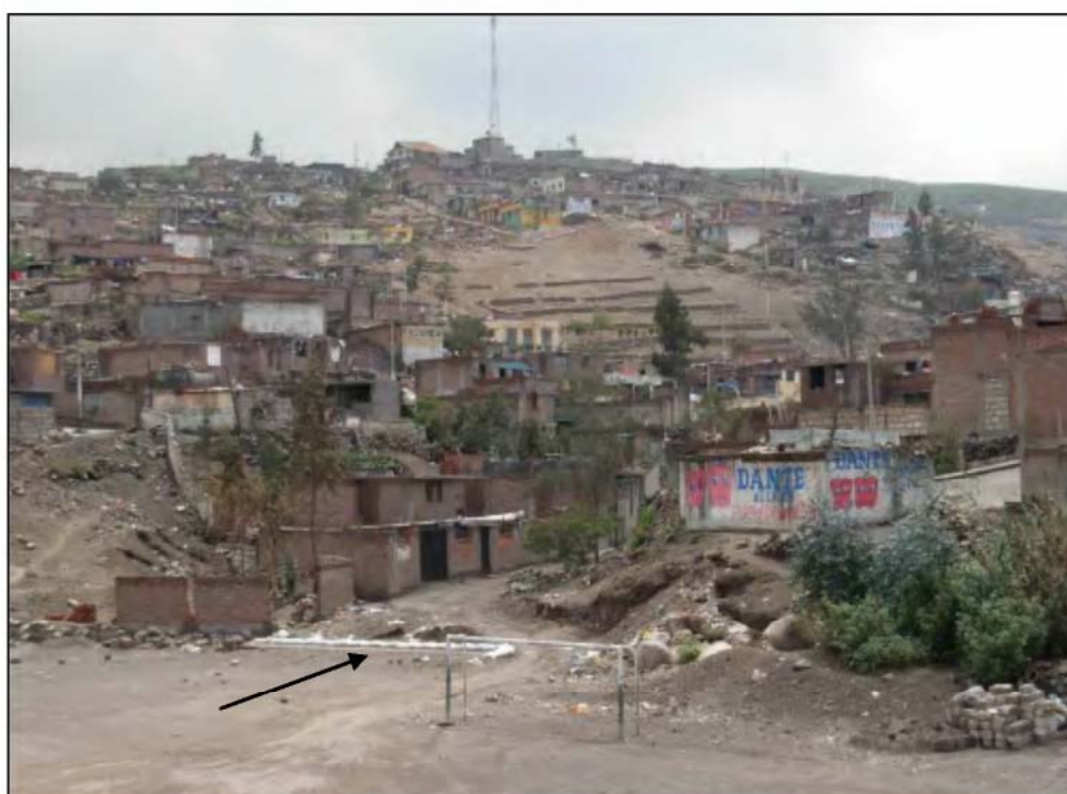
Foto N°23. Vista del sector tripartito (sector 3). La flecha señala el inicio del canal de agua, hasta donde desembocan las aguas producto de lluvias

Los tres sectores descritos anteriormente son afectados por el agua que baja a través de un canal artesanal de Javier Heraud (parte alta) hasta Villa Unión. También, entre enero a marzo las fuertes lluvias generan escorrentías que producen erosión en el Sector 1 (parte alta de Javier Heraud) e inundan las