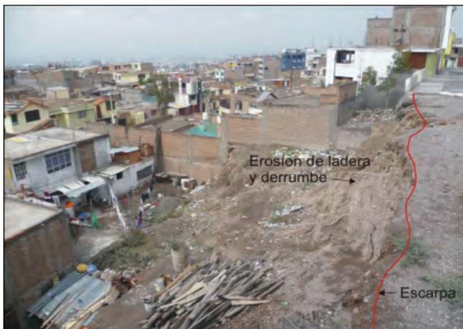
Foto N° 12. Vista del talud inferior de la calle Mollendo (tramo 1) donde se aprecia la escarpa de la zona de derrumbe.

En este tramo, se vienen produciendo procesos de erosión de laderas y derrumbes que afectan viviendas cercanas al talud, tramo de la calle y tuberías de desagüe (Foto N° 12).