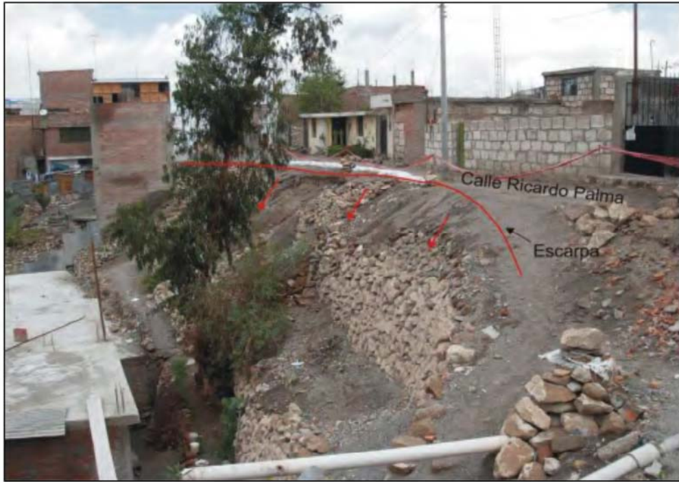
Foto N° 6. Cuarta cuadra de la calle Ricardo Palma donde los procesos de erosión y derrumbe vienen afectando dicha calle. Es necesario resaltar que anteriormente los pobladores han realizado pircas para estabilizar el talud.