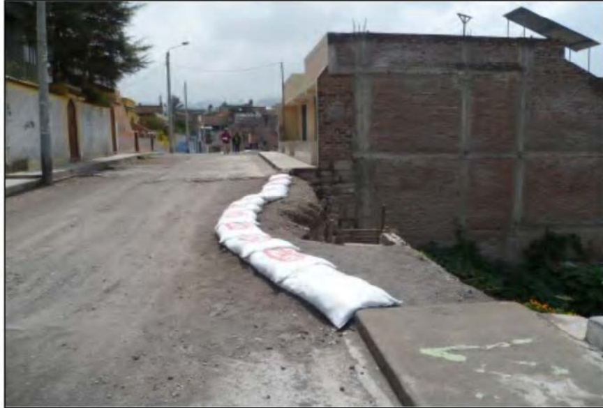
Foto N°15. La calle Mollendo (Tramo 3) en su borde oriental es afectada por procesos de erosión de laderas y derrumbes.

En este tramo, sobre la calle Mollendo se observa una vivienda donde habitan 2 familias (8 personas). Mientras al pie del talud existen 2 viviendas en las que habitan 3 familias (aproximadamente 12 personas). Dichas viviendas tienen por lo menos 30 años de antigüedad, según versiones de sus habitantes.