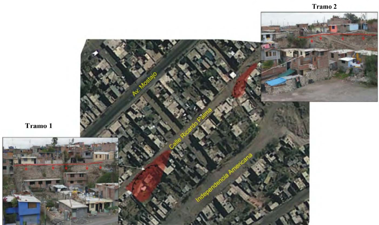
Foto N°5. Imagen Google de la calle Ricardo Palma, entre 3era y 4ta cuadra, donde los procesos de erosión y derrumbe vienen afectando dicha calle y viviendas. Además se presentan dos vistas de las áreas estudiadas.